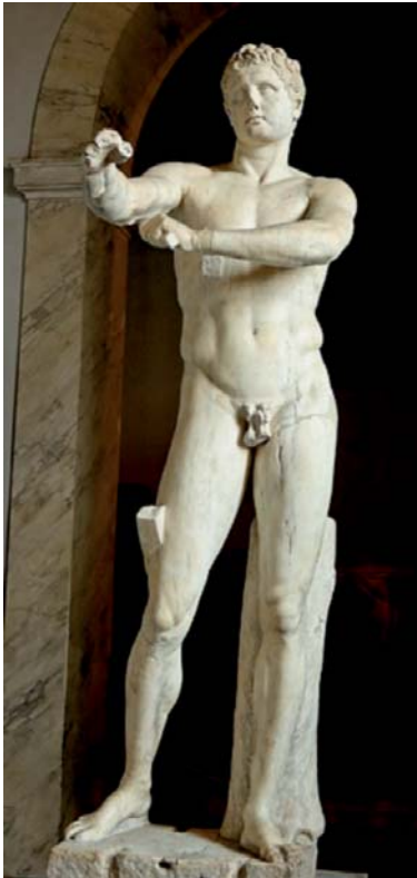
L'Apoxyomène de Lysippe.