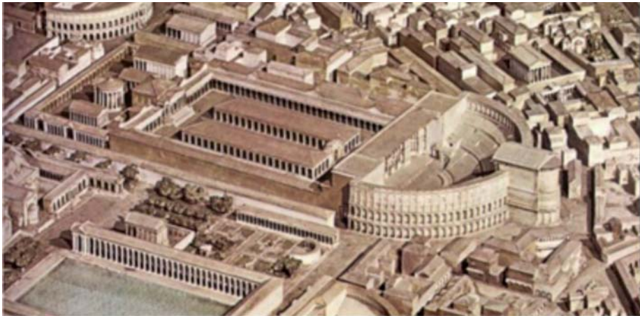
Théâtre de Pompée.