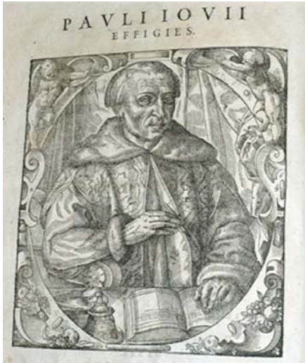
Portrait de Paulo Giovio.