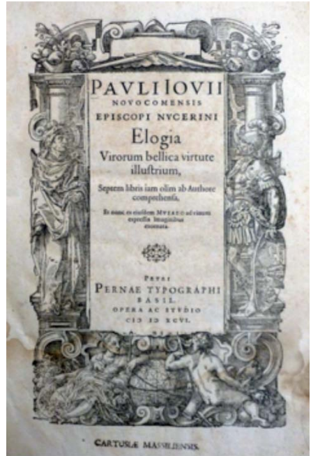
Page de titre de l'ouvrage de Paolo Giovio (Édition de 1596).