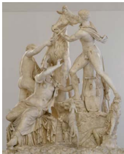
Le Taureau Farnèse.