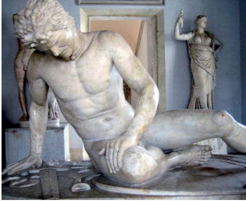
Le Gaulois mourant.