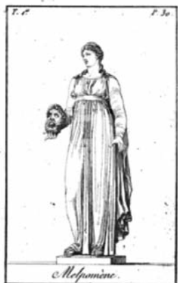
Melpomène, muse de la tragédie.