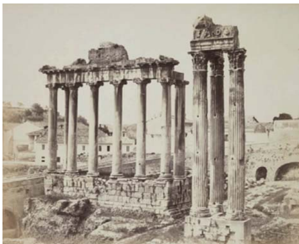
Temple de la Concorde (gravure ancienne).