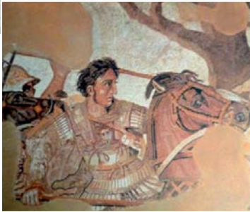
La cohorte des amis d'Alexandre (mosaïque).