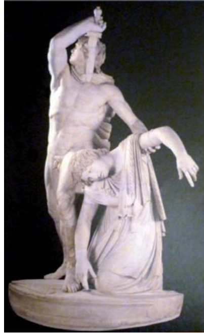
Le Gaulois se suicidant.