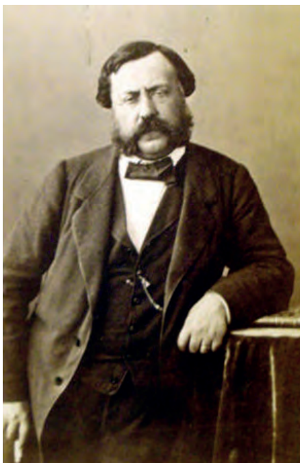
Figure 6 - Félix Sabatier par Nadar, dans les années 1870