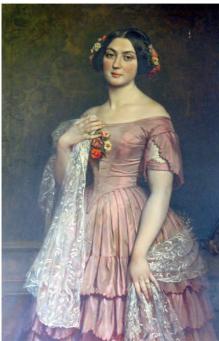
Figure 7 - Marie Sabatier en costume de soirée, par Dominique Papety (collections de l'Hôtel de Lunas)

En dépit des réticences de Félix (21) , le mariage est célébré en 1842 à Montpellier et l'union entre les deux familles consolidée. Les jeunes époux s'installeront bientôt dans l'une des ailes de l'Hôtel de Lunas que possède Zoé Granier, le père de la jeune femme, et qu'ils vont entièrement transformer. Pour cela, Félix va passer un contrat avec son beau-père : il prendra en charge la totalité du coût des aménagements contre une exemption de loyer pendant dix ans. Les travaux (consistant à l'élévation du bâtiment d'un étage et à la réorganisation complète des espaces) débutent en 1843 et ne seront officiellement inaugurés qu'en février 1846, au cours d'une redoute (22) , pour laquelle près de 400 invitations sont lancées.