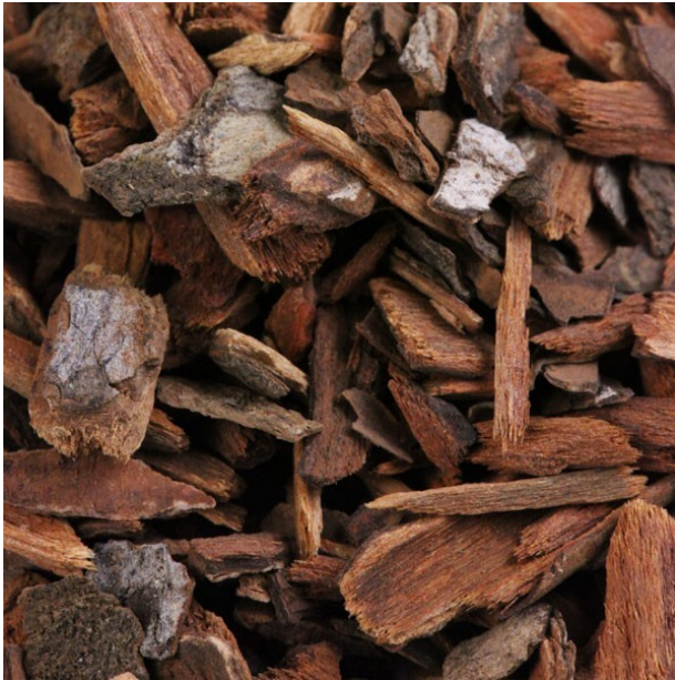
Ecorce de quinquina, image Herboristerie suisse, Strasbourg